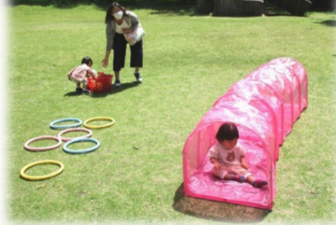
木陰でくつろぎタイムも…♪

『遊びの広場』を万葉の里公園で開催します。おでかけ号におもちゃを積んで出かけて行きます!自然の中でのびのび遊びましょう。対象地区の方には案内をお届けします。地域の親子が出会える場になるといいなと思いますので、気軽に来てくださいね。