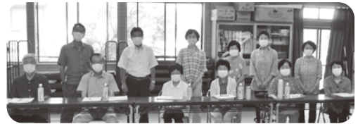
坂本地区福祉委員会の皆さん

いなべ市では、平成29年より自治会内での話し合い、情報交換の場「福祉委員会」の設置を推進しています。今回は、長きに渡って活動を行ってきた、坂本地区福祉委員会(藤原町坂本地区)を取材しましたので紹介します。