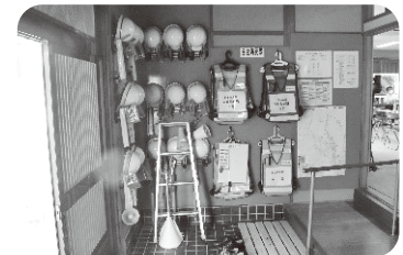
自主防災隊のグッズ

また、日頃からの関係づくりの場として、ボランティアが主体となったサロンを定期的に開催しています。こういった気軽な集まりの中でも、安否確認や見守り活動に関する会話があり、地域の中でなくてはならない場になっています。