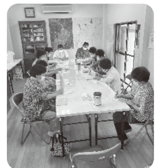
サロン再開に向けた検討会

新型コロナウイルスの脅威が治まっても、前のような地域の状態に戻るのか心配しています。このような状況を乗り越えるには、有事の連携や対策を協議する場としての福祉委員会が重要になると感じています。これから、活気のある坂本地区にするにはどうしたら良いのか、みんなで前を向いて話し合っていきたいと思います。