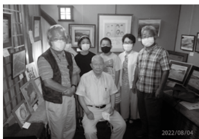
絵本「我が家族の絆と吾が生きがい」出版記念展