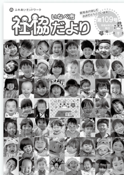
今年1月発行の社協だより

《お問合せ》 総務課 総務人事係 ☎41-2942 ✉info@inabewel.or.jp