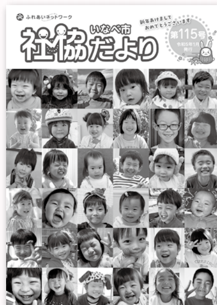
今年1月発行の社協だより

問 申込先 総務課 総務人事係 ☎41-2942 ✉info@inabewel.or.jp