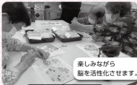
脳トレ・モノづくり