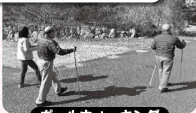
ポールウォーキング