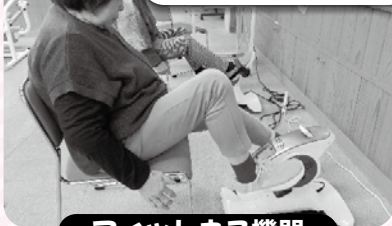
フィットネス機器